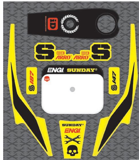
KIT DECO GRAPHIC KIT