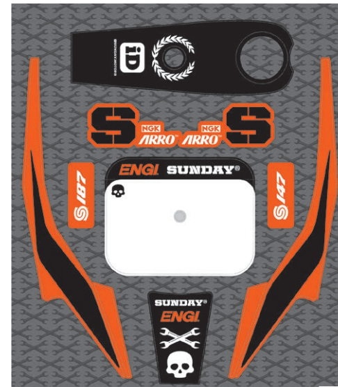
KIT DECO GRAPHIC KIT