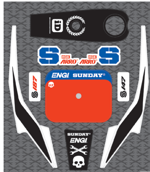
KIT DECO GRAPHIC KIT