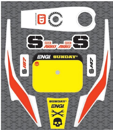
KIT DECO GRAPHIC KIT